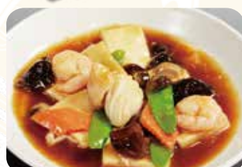
643 什錦豆腐 五目と豆腐の煮込み