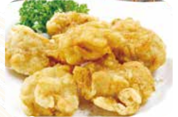
516 炸鶏塊 若鶏の唐揚げ