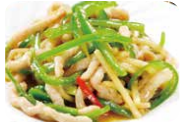
511 青椒肉絲 豚肉とピーマン細切りの炒め