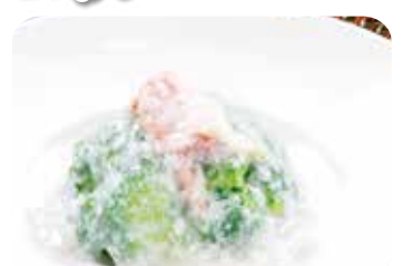
606 蘭花蟹扒 ブロッコリーの蟹肉 あんかけ