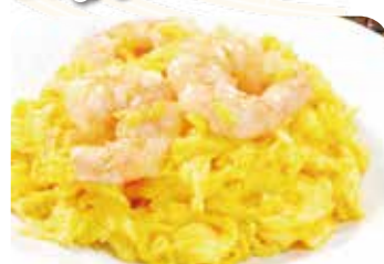
604 蝦仁炒蛋 海老と玉子の炒め