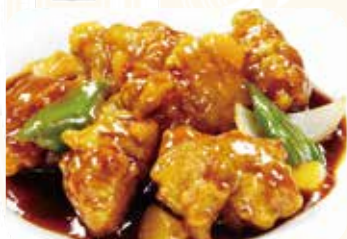
521 黒酢鶏塊 鶏唐揚げの黒酢ソース 辛い かけ