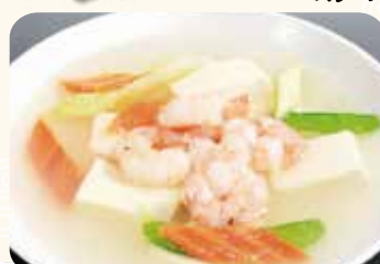
644 蝦仁豆腐 海老と豆腐の煮込み