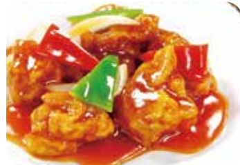
509 古老肉 スプタ