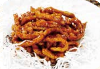
513 京醬肉絲 豚肉細切りの甘味噌炒め