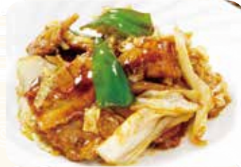
514 回鍋肉片 ホイコーロウ