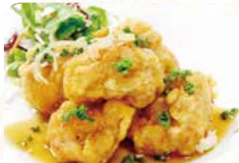
517 油淋鶏 ユーリンジー