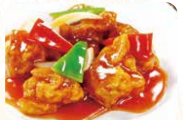
520 糖酢鶏塊 鶏団子の甘酢ソースかけ