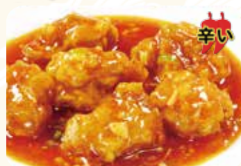
522 魚香鶏塊 鶏唐揚げの香り辛い炒め