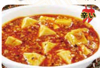
601 麻婆豆腐 辛い