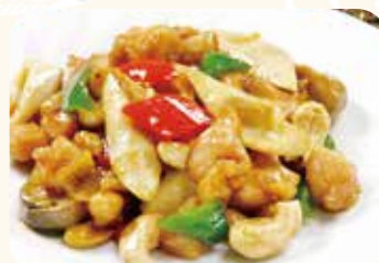
523 腰果鶏丁 鶏肉とカシューナッツ の炒め