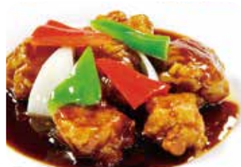
510 黒酢古老肉 黒酢入りスプタ