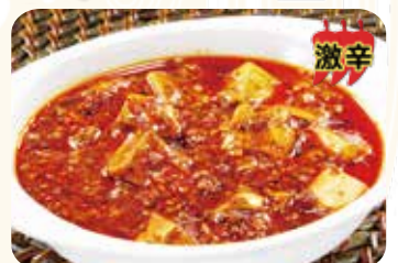
600 陳麻婆豆腐 激辛