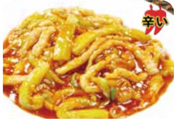
512 魚香茄子 茄子と豚肉の香り 辛い炒め