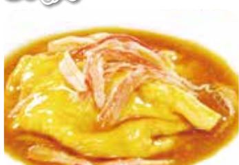
603 蟹肉炒蛋 蟹肉と玉子の炒め