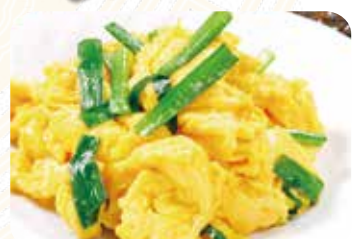
602 韭菜炒蛋 ニラと玉子の炒め