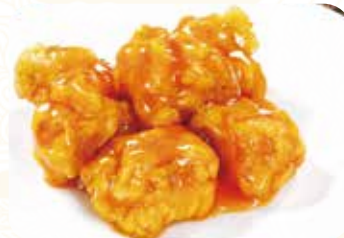
519 橙汁鶏塊 鶏団子のオレンジ ソースかけ