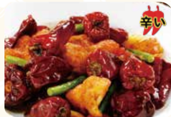
518 天府辣子鶏 鶏肉の四川唐辛子 辛い 山椒炒め